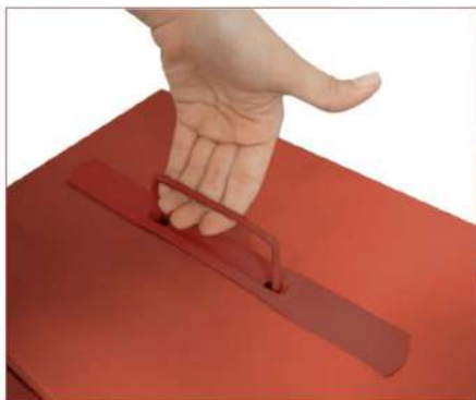
○ Manija desmontable