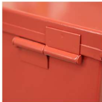
○ Bisagra trasera